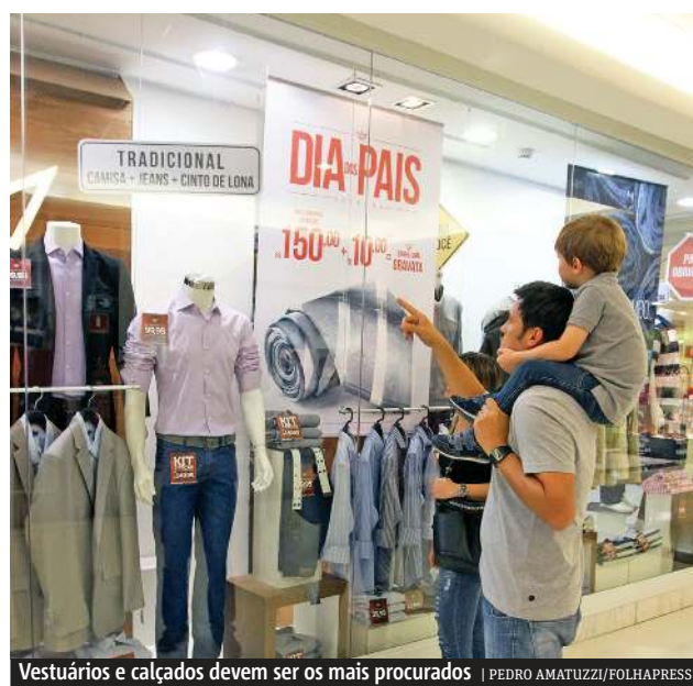
Vestuários e calçados devem ser os mais procurados