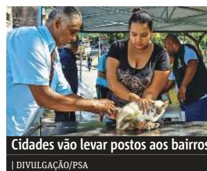
Cidades vão levar postos aos bairros | DIVULGAÇÃO/PSA

ABC fechou semestre com saldo positivo de 5,7 mil postos, mas com 17% da população sem emprego PÁG. 02