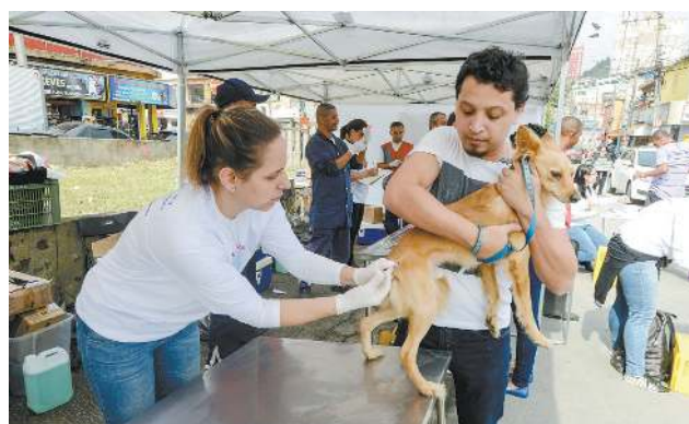
Ação começou no fim de semana em São Bernardo

rá início no dia 15 deste mês. Haverá um posto fixo na Gerência de Controle de Zoonoses, que fica na rua Igarapava, 239, Valparaíso. Outros 120 postos volantes funcionarão em datas específicas nos bairros,