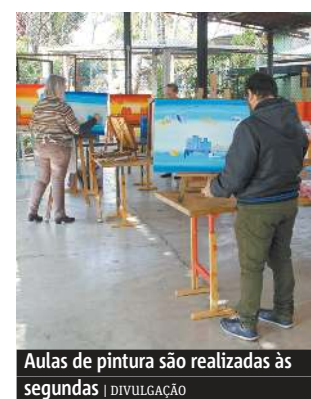
Aulas de pintura são realizadas às segundas

be aulas de yoga às segundas (17h) e quartas (17h30) e de Tai Chi Chuan às quartas (14h), além de Lian Gong às sextas (9h). As atividades são gratuitas, mas é preciso fazer inscrições antecipadas pelo telefone 3356-9050 ou pelo e-mail parqueescola@santoandre.sp.gov.br .