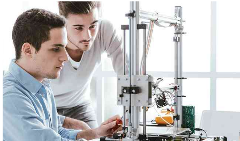
Crédito ajuda a aumentar o acesso dos jovens ao ensino de qualidade, além de diminuir a evasão