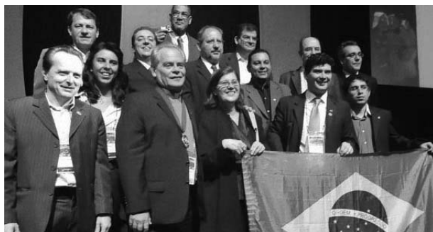
Delegação brasileira na posse do Bispo Paulo Lockmann