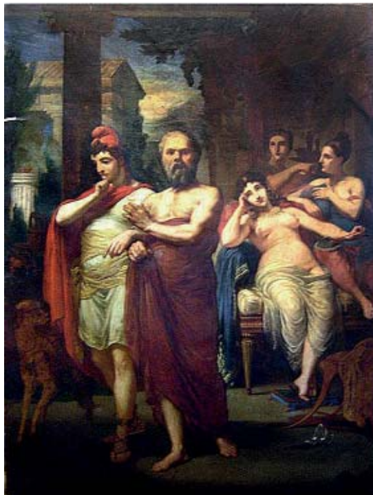
AMÉRICO, P. Sócrates afastando Alcebiades dos braços do vício . 1861.

A imagem apresentada, que expressa a ideia de “filiação”, mostra o mestre Sócrates cuidando da evolução espiritual do seu discípulo.