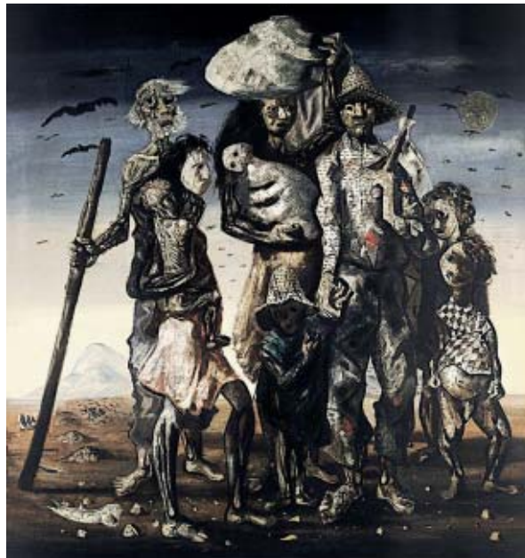
PORTINARI, C. Retirantes . 1944.