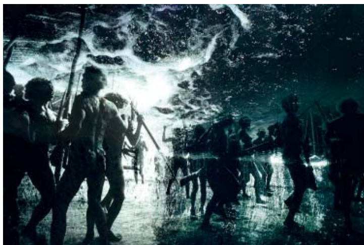
ANDUJAR, C. Desabamento do Céu . 1976.

A fotógrafa suíça Claudia Andujar veio para o Brasil nos anos 1950 e foi uma das primeiras pessoas brancas a entrar no território indígena, na fronteira entre os estados do Amazonas, Roraima e a Venezuela. Ela retratou, na fotografia abaixo, um momento da festa Yanomami que representa o mito do desabamento do céu, e teceu o seguinte comentário: “o desabamento do céu é a história do fim do mundo. É uma festa bem bonita. São homens que estão lutando para que o mundo não acabe. Faz parte da mitologia Yanomami a ideia de que o mundo vai acabar se a gente não tratar bem um ao outro. Quando [o mundo] estiver cheio de gente ruim, que sempre briga, vai ser o fim do mundo”.