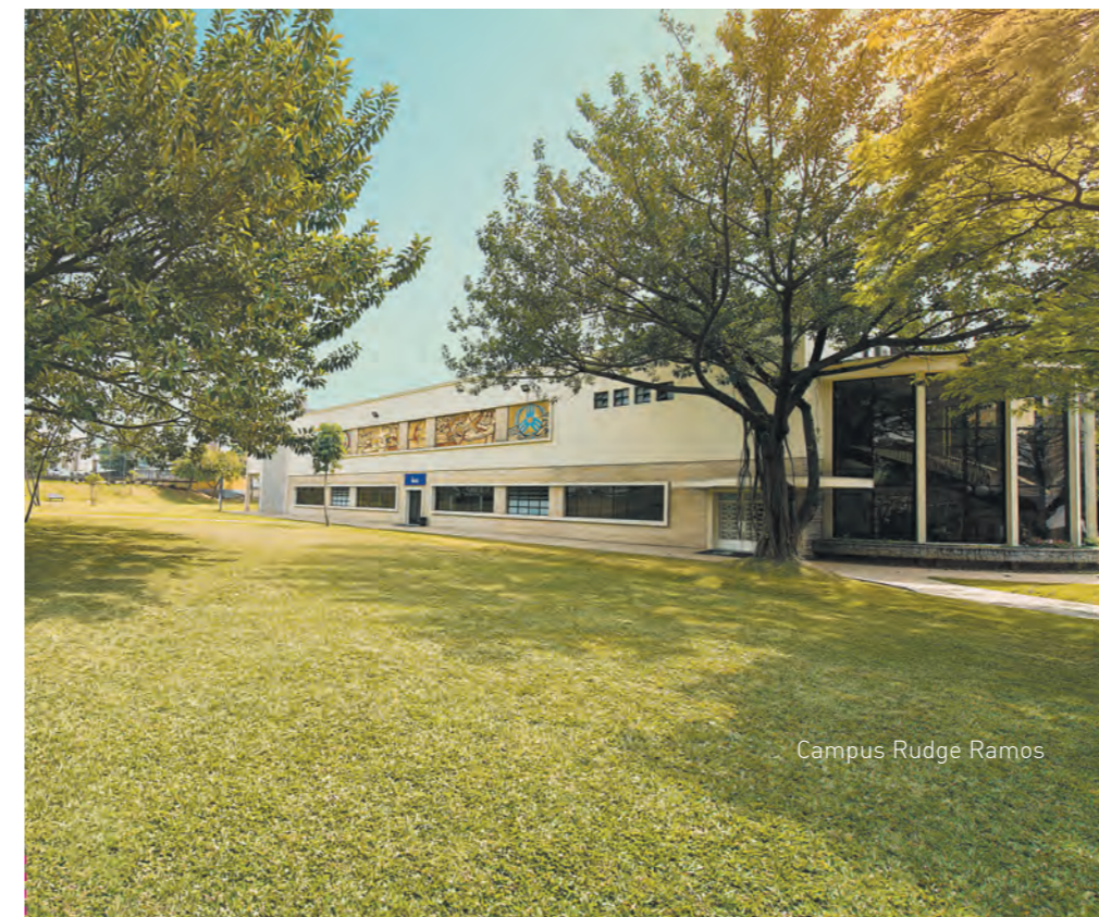
Campus Rudge Ramos

Consulte oferta disponível no site metodista.br/lato