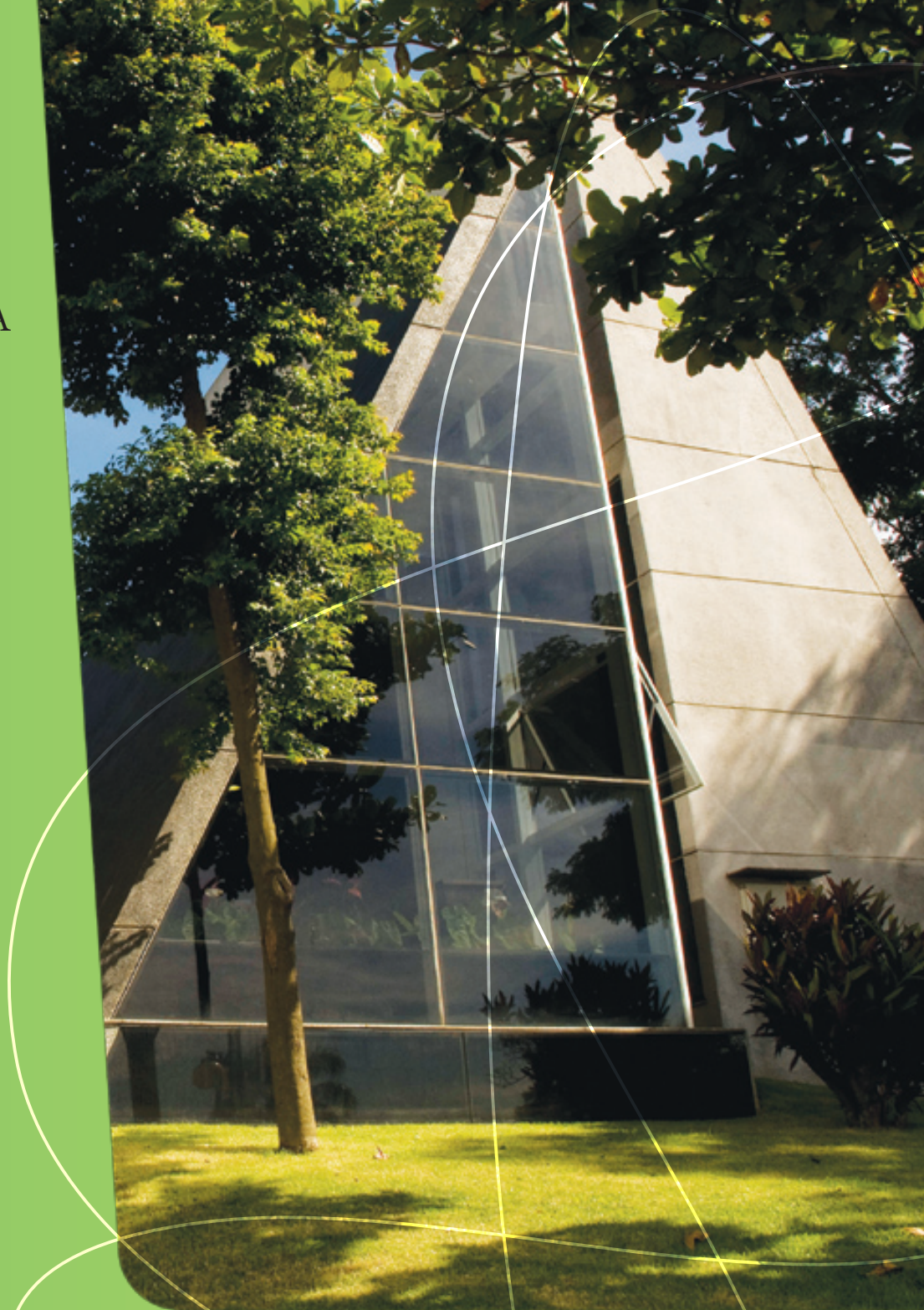
Capela - Campus Rudge Ramos

Tanto nos Colégios como na Universidade, a Pastoral atuou em 2007 em campanhas, projetos solidários, momentos devocionais, cultos e celebrações. Prestou atendimento pastoral a alunos, professores e funcionários em momentos de dificuldades e crises. Realizou visitas a funcionários enfermos e prestou assistência espiritual às famílias em caso de falecimentos. Nos momentos de festa, nascimento de filhos de funcionários, formaturas, eventos e reuniões, a Pastoral também se fez presente, além de participar ativamente na recepção aos calouros e seus familiares durante a realização do Processo Seletivo.