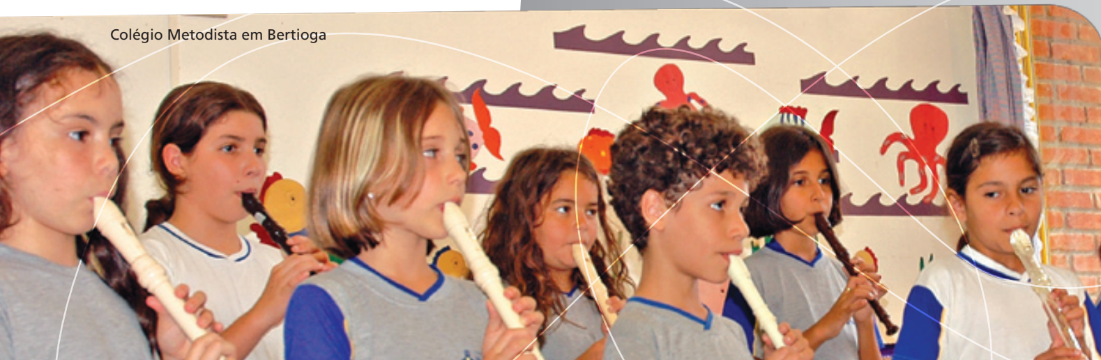
Colégio Metodista em Bertioiga

Esse projeto de extensão, desenvolvido pelo curso de Graduação Tecnológica em Gestão Ambiental da Universidade Metodista de São Paulo, auxilia a direção do Colégio a criar atividades interdisciplinares para a Educação Infantil e os Ensinos Fundamental e Médio. Isso permite que os alunos compreendam melhor onde vivem e saibam conviver em harmonia com o meio ambiente que os circunda.