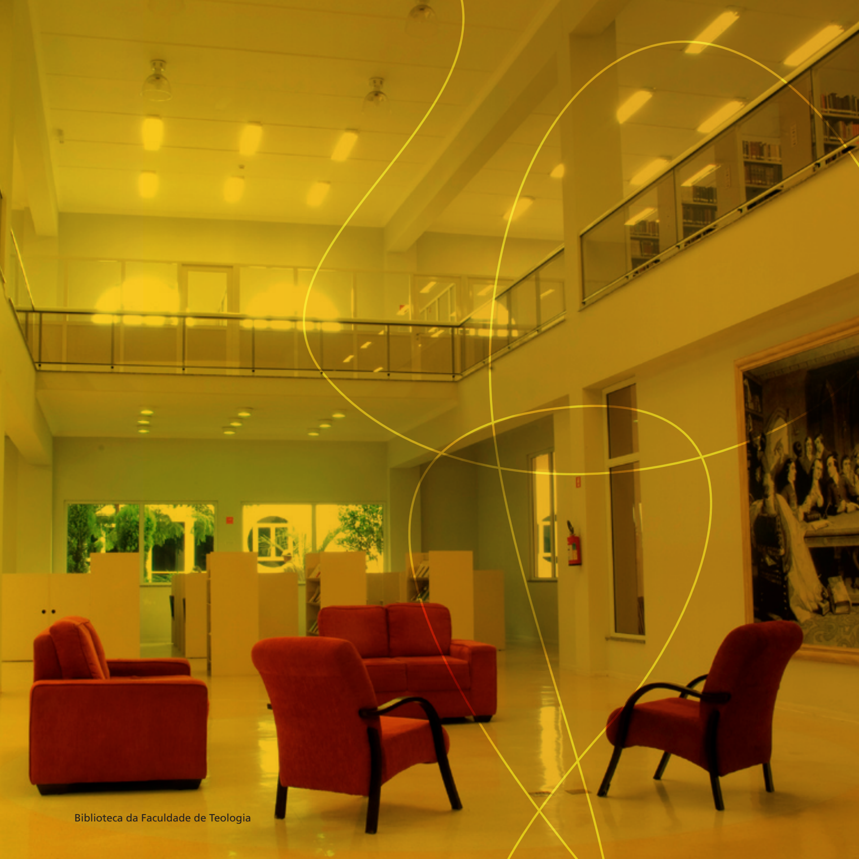
Biblioteca da Faculdade de Teologia