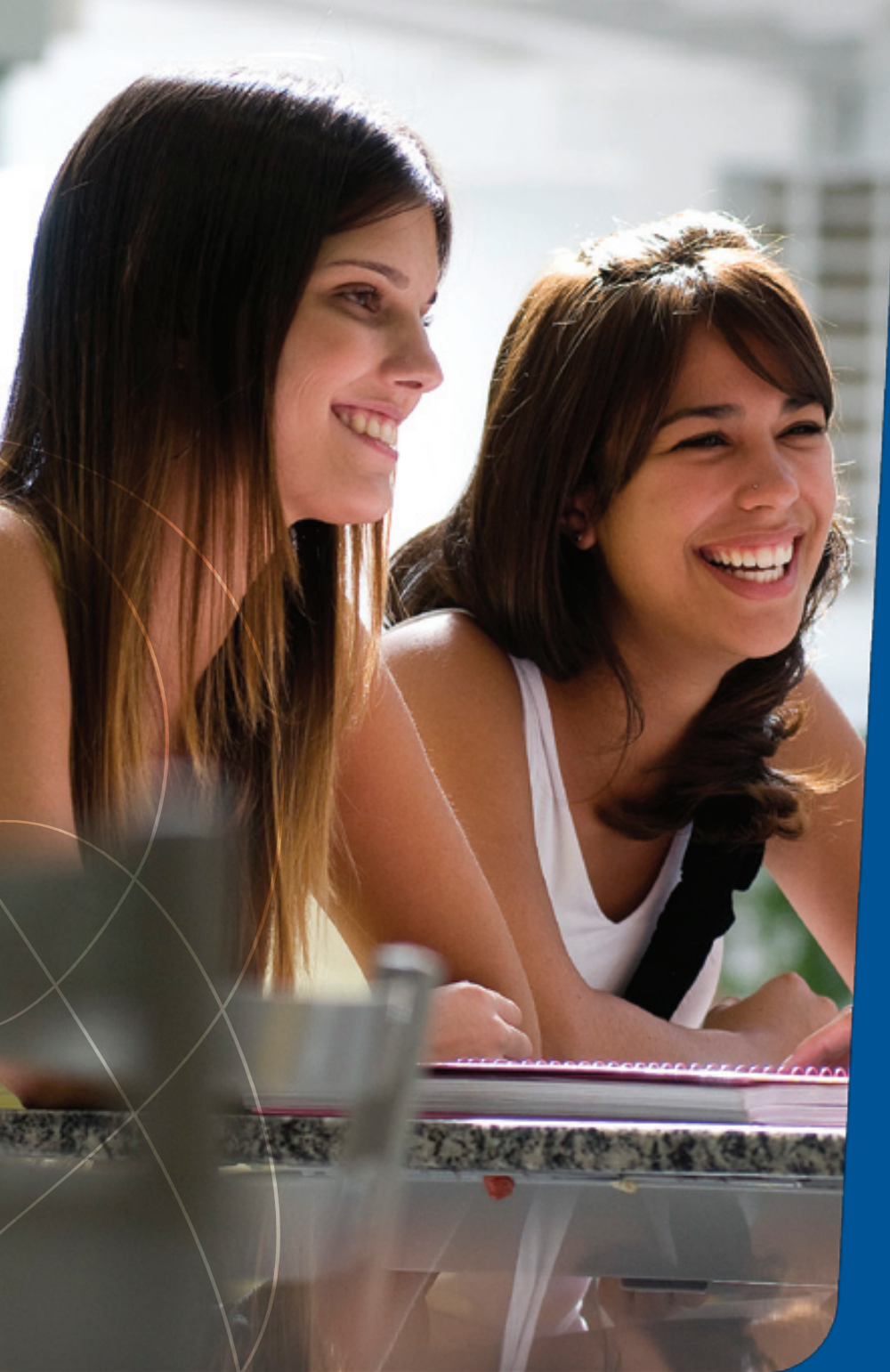
Alunas no Centro de Convivência - Campus Rudge Ramos