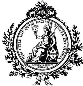
ACADEMIA DAS CIÊNCIAS DE LISBOA

“A Academia das Ciências de Lisboa é uma das mais antigas instituições científicas nacionais de existência contínua. Foi fundada, no dia 24 de dezembro de 1779, durante o reinado de D. Maria I, sob o signo inspirador de um verso de Fedro*: